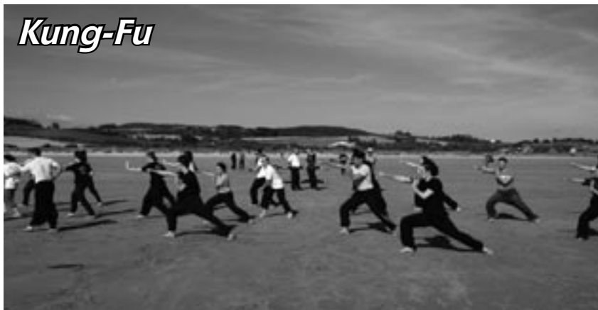
Plage de Pentrez, Saint Nic - 29127 Plomodiern