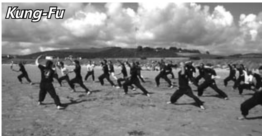
Plage de Pentrez, Saint Nic - 29127 Plomodiern

Fiche à retourner à : Académie Pascal Plée - YMAA France 34, rue de la Montagne Ste Geneviève - 75005 Paris Tél. : (33) 01 43 25 57 42 Fax: (33) 01 44 41 63 38 Site : www.pascal-plee.com Mail : pascalplee@free.fr